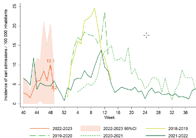
Figure : évolution de l'incidence des admissions à l'hôpital dues à une infection respiratoire, depuis 2018

De nombreuses mesures et recommandations contre le COVID-19 sont également utiles pour limiter le nombre d'infections respiratoires en général :